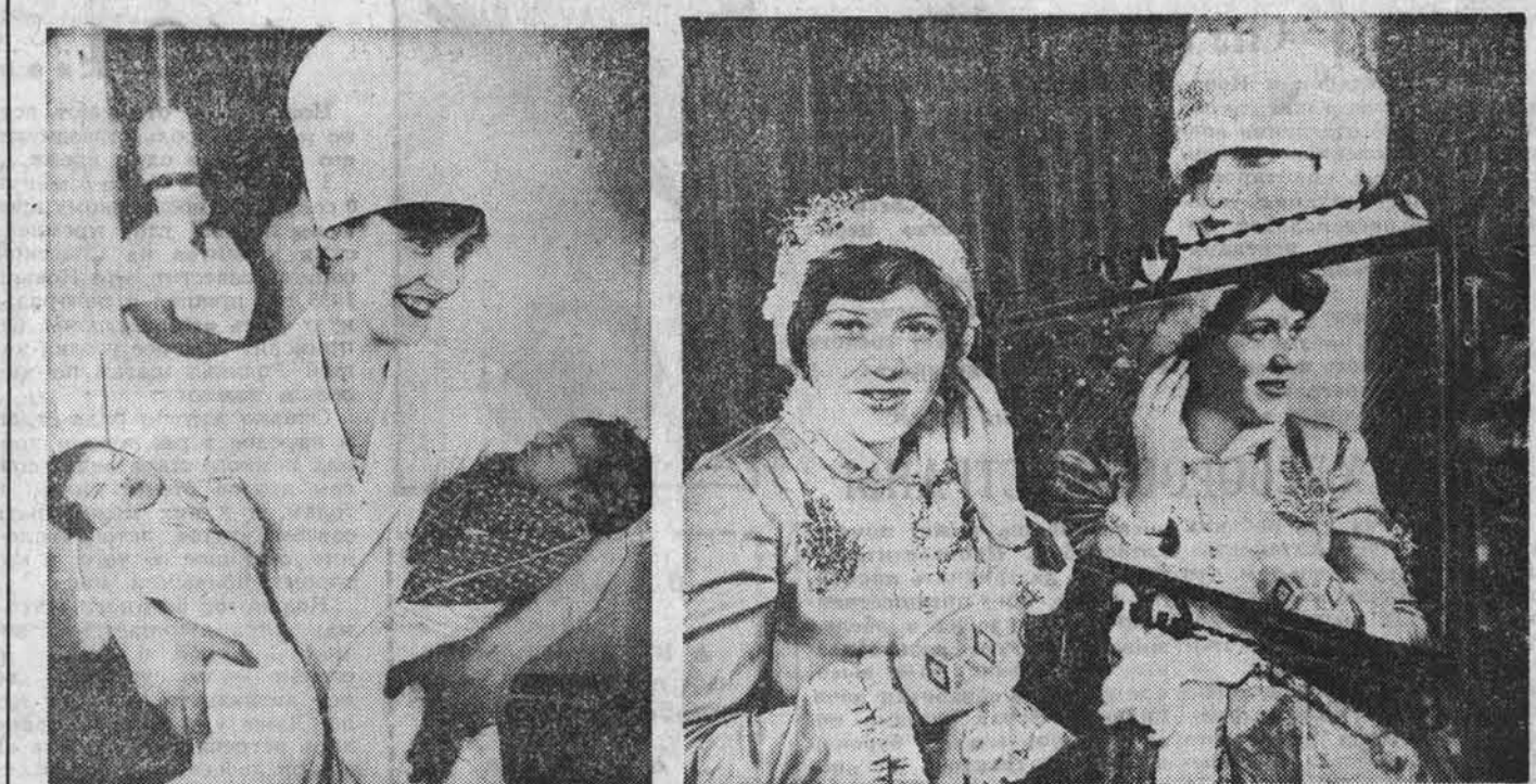
Новый год шагает по стране. Праздничное настроение всюду: на детских утренниках и новогодних балах, в семьях и на улицах городов. Пожалуй, самое радостное настроение у ребятишек, ведь у них каникулы. И даже у этих крошечных малышей, которые родились перед Новым годом, тоже праздник. Биография у них только начинается, и начинается она с Нового, 1986 года, объявленного ООН годом Мира.