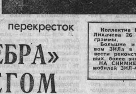
Коллектив Московского автомобильного завода имени И. А. Дихачева 26 ноября завершил выполнение пятилетней программы.

Большинство и ответственные задачи стоят перед коллективом ЗИЛА в новой, двенадцатой пятилетке. Предстоит провести реконструкцию предприятия и перейти на выпуск новых, более экономичных грузовых автомобилей ЗИЛ-4331.