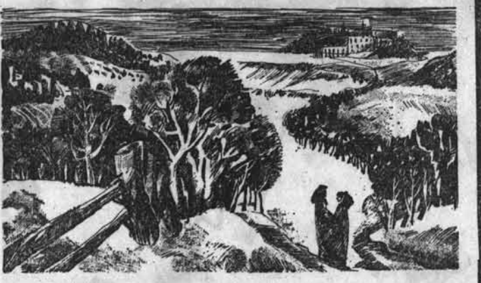
Белы снега. Захватит дух — Распишет стекла в каждой раме. НИКОЛАЙ ВАЖАН. Рис. Е. Никитиной.

нчал песни В. Соловьева-Седого — «Вечер на реиде», «В тумане скрылась милая Одесса», К. Листова — «В землянке», М. Блантера — «Жди меня», Н. Богословского — «Темная ночь», М. Табачникова — «У Черного моря».