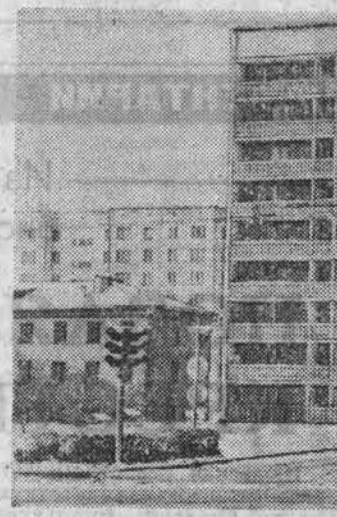
«УГОЛОК БАРНАУЛА».