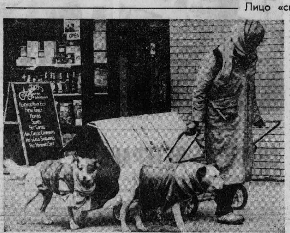
НЬЮ-ЙОРК. Двумя и в одежде ходит эта несчастная женщина с двумя своими единственными «друзьями» по улицам большого города, гонимая холодом, голодом и нищетой. Страдания и постоянные лишения сделали ее старше, молчаливее и угрюмее. А надежд на лучшее будущее никаких: ежесекундно сокращаются и без того мизерные социальные средства на нужды миллионов таких обездоленных американцев. «Общество всеобщего благополучия» бросило их на произвол судьбы. А между тем Вашингтон выделяет все новые миллиарды долларов на наращивание ядерных вооружений.