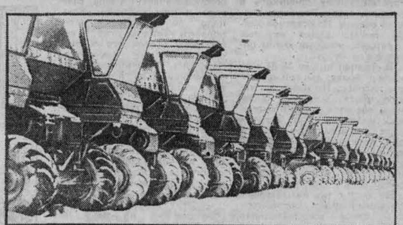
Ельцовский район.