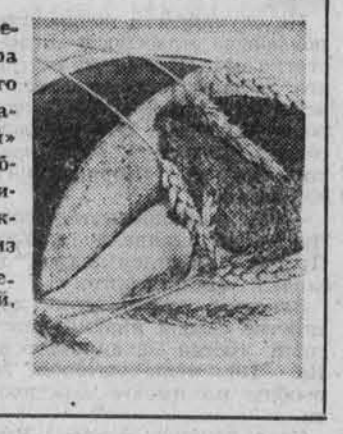
Сегодня мы предоставляем