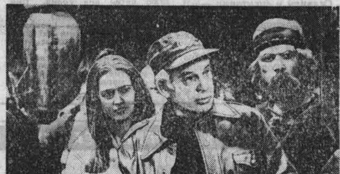
Фильм Станислава Ростюцкого