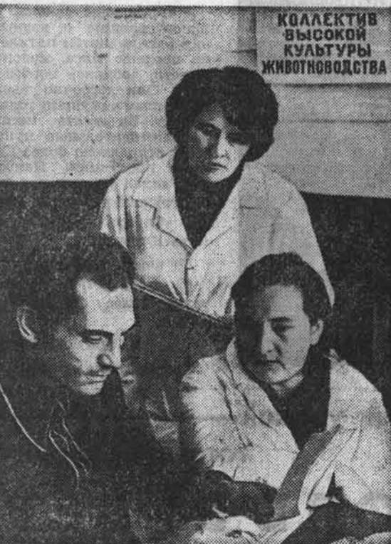
КОЛЛЕКТИВ ВЫСОКОЙ КУЛЬТУРЫ ЖИВОТНОВОДСТВА