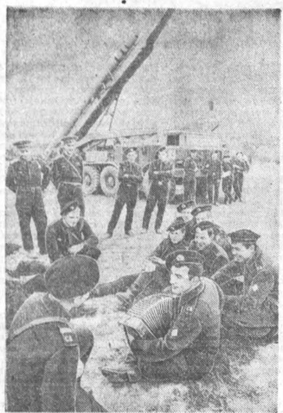
НА СНИМКЕ: в одной из воинских частей, ракетчики на приеме.