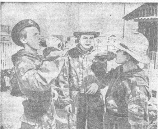
НА СНИМКАХ: жарко; «Есть в порядке!»; под огнем «неприятеля».