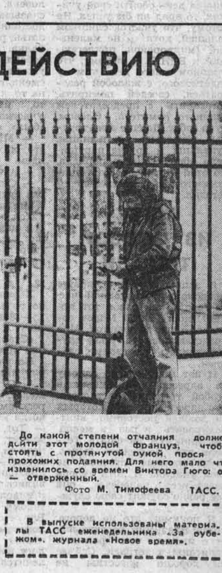
До какой степени отчаяния должен достигнуть этот молодой француз, чтобы стоять с протянутой рукой, прося у прохожих подаяния. Для него мало что изменилось со времен Виктора Гюго: он — отверженный.