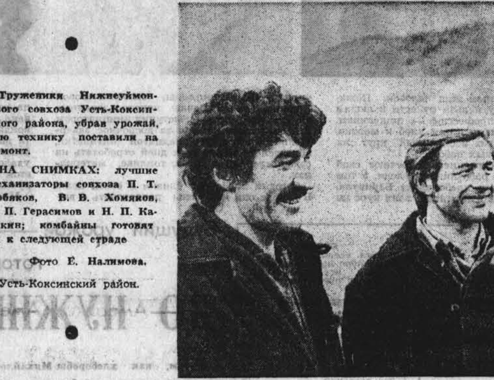
Труженики Нижнеуймонского совхоза Усть-Коксинского района, убрав урожай, всю технику поставили на ремонт.