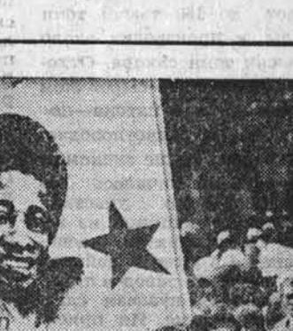
Десятки тысяч представителей прогрессивной общественности из многих городов страны провели манифестацию в Бонне (на снимке). Они потребовали от режима аппарата ЮАР немедленного освобождения Нельсона Манделы и других политических заключенных ЮАР.

Италия ПОРТУГАЛИЯ ЗА ИНТЕРЕСЫ ТРУДЯЩИХСЯ ЛИССАВОН. (ТАСС). Реакция последовательно широких политических слоев Португалии по поводу невыгодных условий присоединения Португалии к Общему рынку.