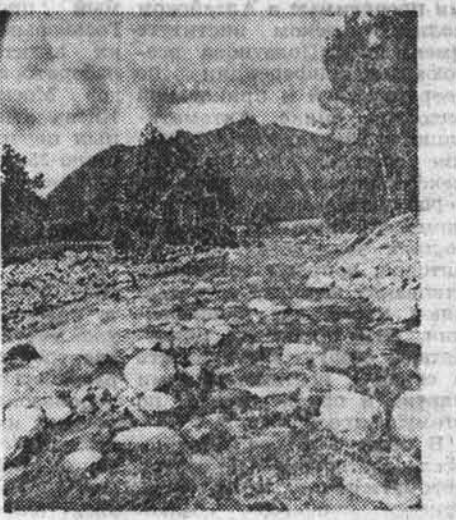
Аромата. Еще можно найти семейку крылатых гусеничек, мохолок, зеленых рылец, брусничную полянку.

Среди белых стволов и дымчатых кружевных крошечек появляются пики саляирских пихт.