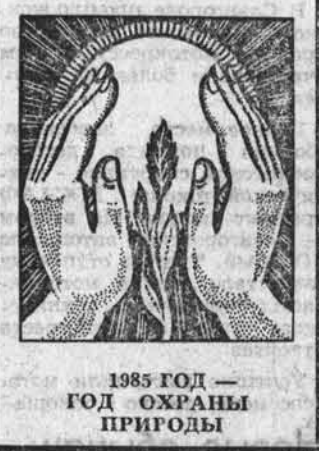
1985 ГОД — ГОД ОХРАНЫ ПРИРОДЫ