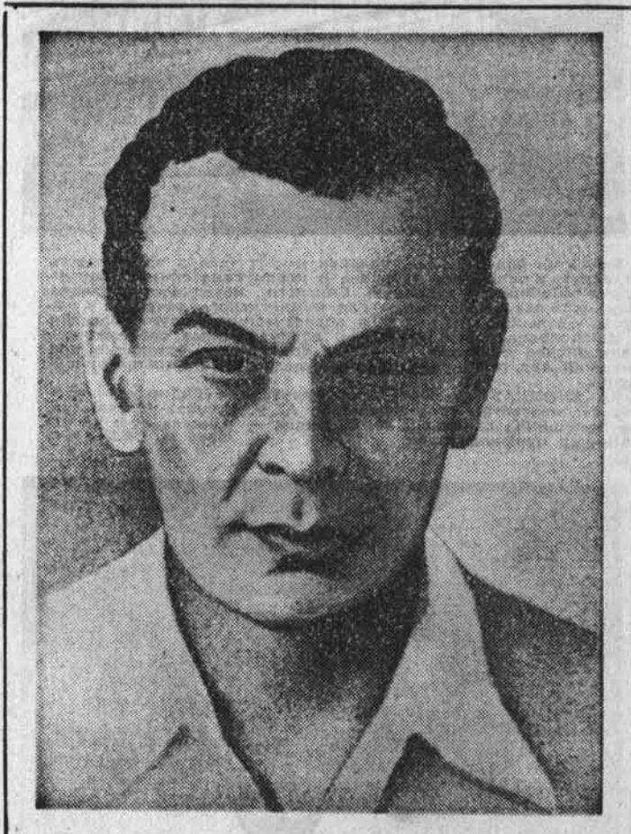
Музей имени Рихарда Зорге создан клубом интернациональной дружбы Рубцовской средней школы № 10 десять лет назад. А находится школа на улице, также носящей имя героя. Это не случайное совпадение: именно по ходатайству юных рубцовчан бывший Шелковинский тракт был переименован в улицу Рихарда Зорге. В честь сорокалетия Любды здесь состоялся большой праздник, на который пригласили ветеранов войны, органов госбезопасности, шефов. Активисты КИДа подготовили литературно-музыкальную композицию. А кульминацией праздника стало открытие мемориальной доски с барельефом Рихарда Зорге. Школьники провели эстафету на призыв героя, заложив в память о бесстрашном советском разведчике аллею.

Так называемый Герой Советского Союза Рихард Зорге, отважный разведчик, коммунист, пламенный патриот, антифашист, он выполнил свой долг до конца. Не угасает с годами народное восхищение его подвигом, и личность мужественного борца за мир служит для нас примером, достойным подражания. Ширится движение юных зоргецев, красные следопыты собирают и изучают материалы о жизни и подвиге героя, которому сегодня исполнилось бы девяносто лет.