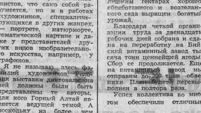
«ВКУСНАЯ МОРКОВЬ».

Одновременно с нашей выставкой в этом же здании музея зрители знакомы с популярной выставкой Николая и Святослава Рерихов. А для многочисленных почитателей их искусства словосочетание «Алтай и Рерих» в последние годы обретает все большую значительность.