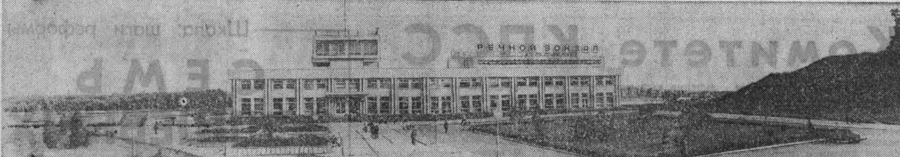
РЕЧНОЙ ВОКЗАЛ.