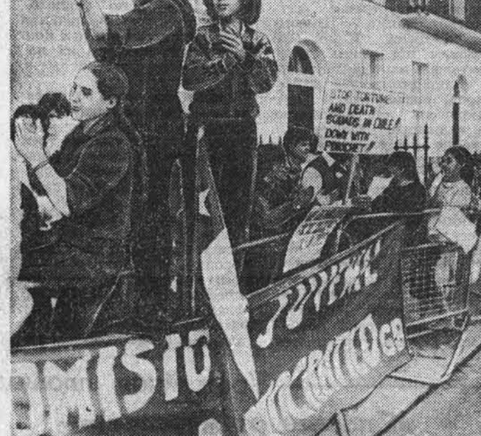
На снимке: пикетчики перед чилийским посольством.