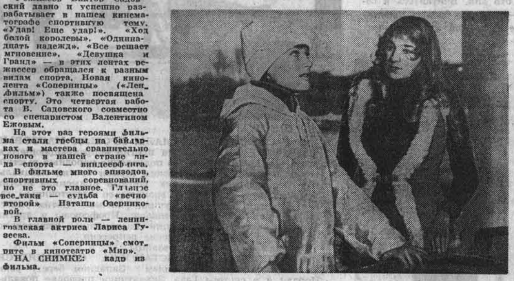
НА СНИМКАХ: кадры из фильма.