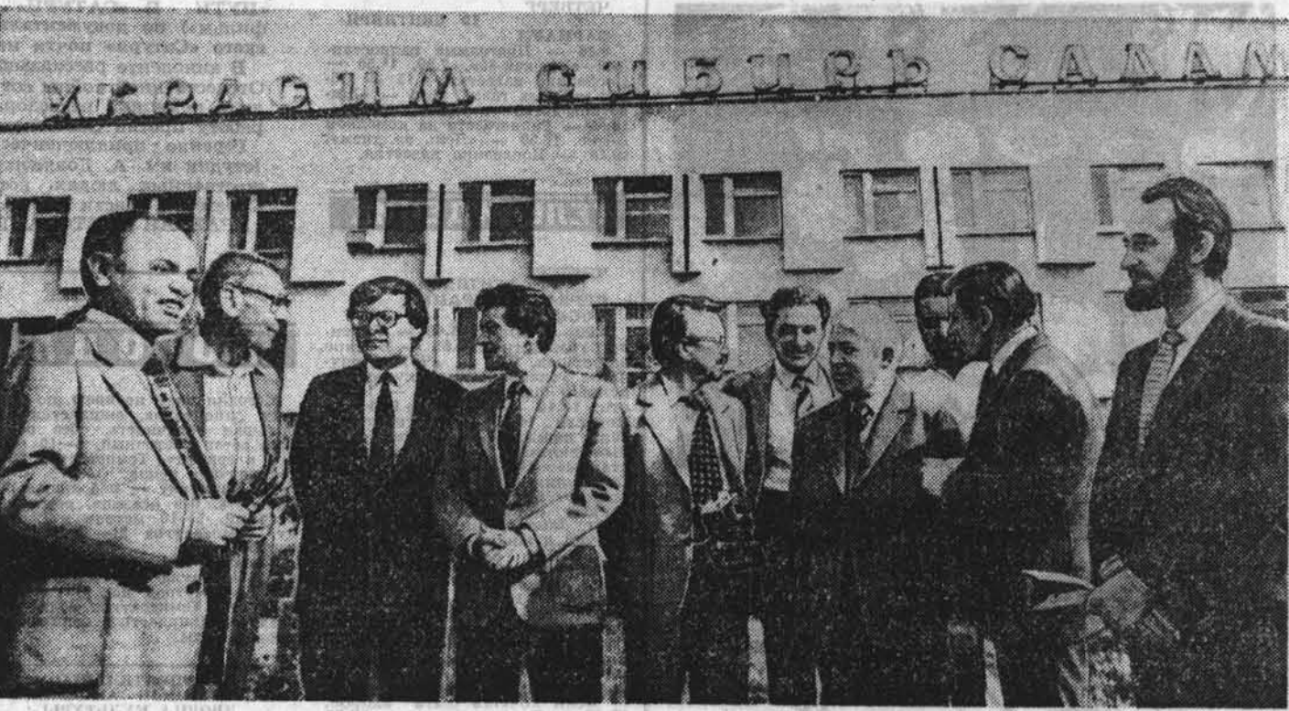
СОВЕТСКОЕ ДЕЛЕГАЦИОННОЕ ПОСОЛСТВО В ВАРШАВЕ

Имеется в крае и филиал Института экономики СО АН СССР — Барнаульская экономическая лаборатория, одна из главных задач которой — оказание научной и методической помощи в разработке планов экономического и социального развития края.