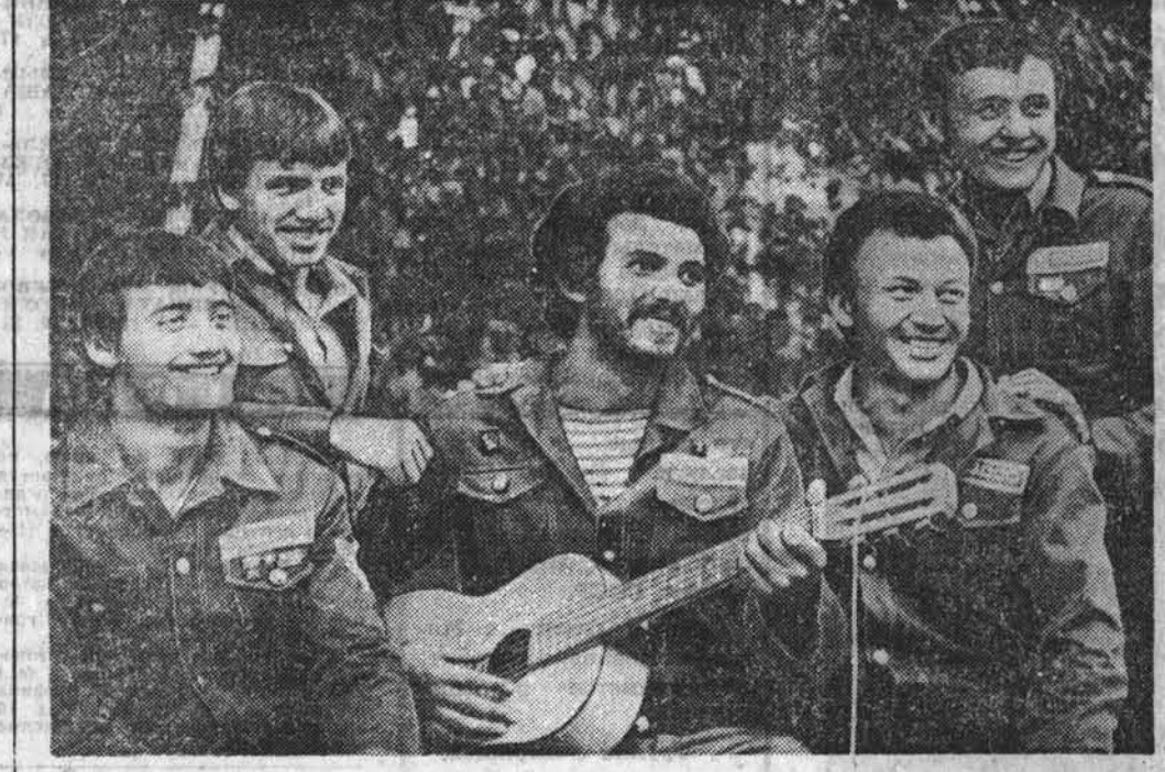
В МИНУТЫ ОТДЫХА.