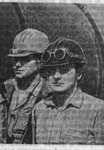
Стройки энергетики: ТЭЦ-3