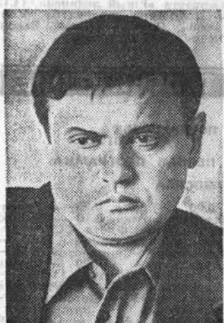
Гореть, чтоб кто-то у огня моих стихов согрелся.

Одна наука у меня — гореть, ноль загорелся.