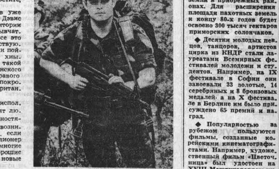
Двое наемников — британцев уже показали.