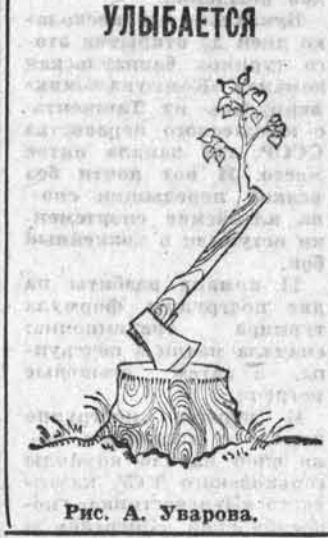
Рис. А. Уварова.

По тропинке от крыльца, На свидание спеша, Повторяю: «Здравствуй, речка, С тихим именем — Иша!». Ты меня улыбой чистой, Как любовью, озаришь, И, звеня в свои мониста, Зажурчишь — заговоришь. Запоешь о чем-то нежном, Вся в серебряных лучах, И в черемухах прибрежных Сразу птицы замолчат. И замрут в мечтах березы, Ивы в думках загрузят... На моем лице, как слезы, Твои брызги заблестят.