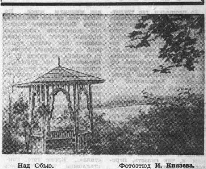
Над Обью.

Засыпают люди в августе лекарственные травы. Великое их множество в лесах, на лугах края. От того, как поведет себя человек, зависит будущий урожай грибов, ягод трав. Август привлекает не только изобилием, которое дает нам природа. Но и ее неповторимыми картинами. Только в августе можно увидеть столь яркие звездоплады. Да и сами звезды иные — будто начиченные и промывные, ярко сияют в черном небе. Сверкают августовскими ночами зарницы у горизонта, а воды горной красавицы Катунь зеленеют. Еще множество неповторимых красок у августа, но самая замечательная — краска спелого хлебного поля, покой которого скоро нарушит горячая осенняя пора — жатва.