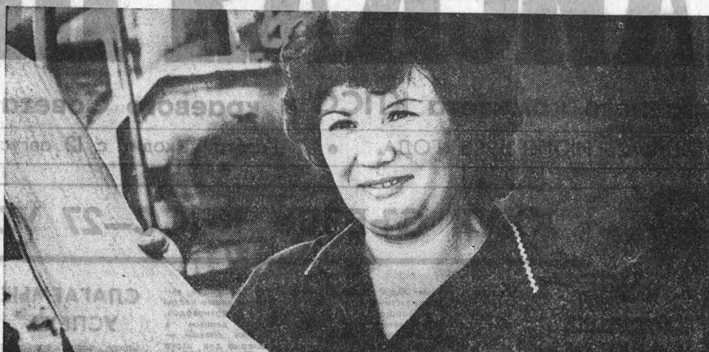
130-140 процентов — такова ежедневная норма выработки на фабрике мебели Барнаульской мебельной фабрики...