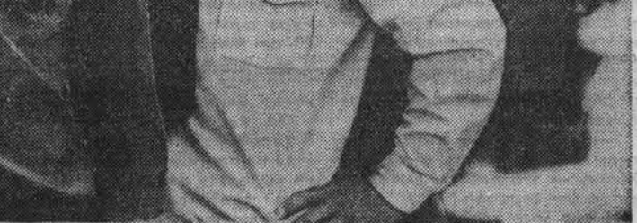
Сегодня — День работников морского и речного флота