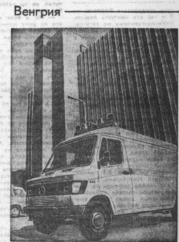
НА СНИМКЕ: новое здание службы скорой помощи в Будапеште.

Власти ФРГ, проявляя партией, действуют вступе в административной США, не являясь сил и средств, всеохватывают протестах против притеснений. Учительского «наблюдения» прав человека в соответствии с общими принципами ООН.