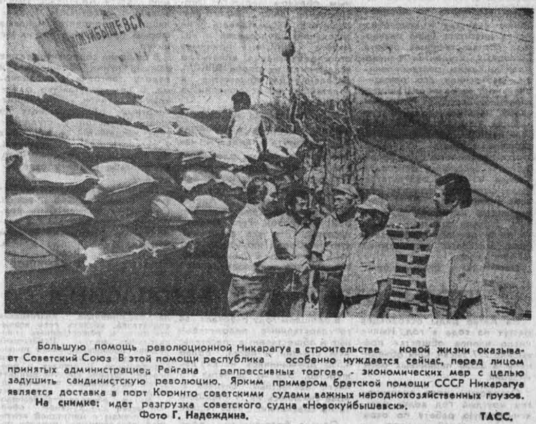
Большую помощь революционной Никарагуа в строительстве новой жизни оказывают Советский Союз. В этой помощи республика особенно нуждается сейчас, перед лицом принятых администрацией Рейгана репрессивных торговых экономических мер с целью задушить сандинистскую революцию. Ярким примером братской помощи СССР Никарагуа является доставка в порт Коринто советскими судами важных народнохозяйственных грузов. На снимке: идет разгрузка советского судна «Норкуйбушеск».