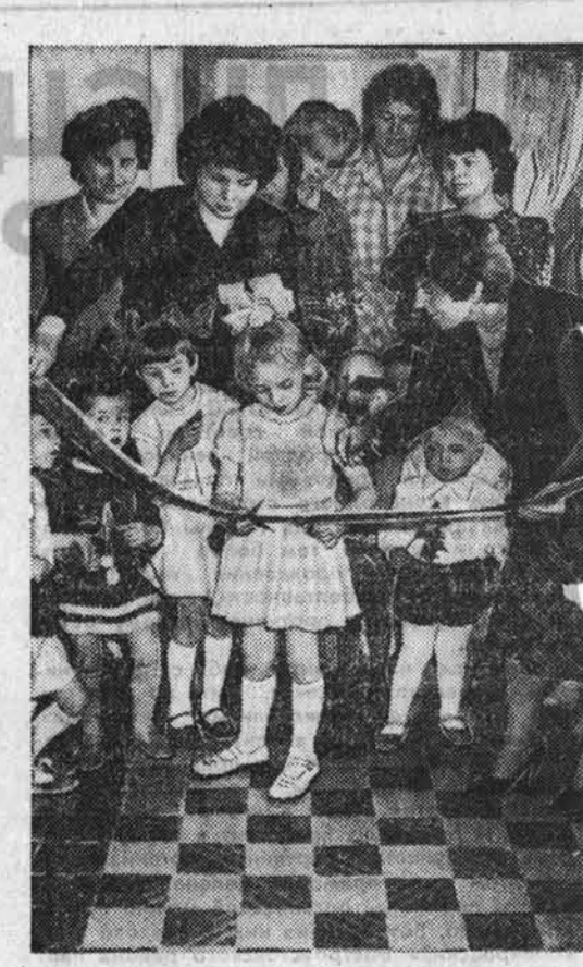
Для занятий, которые нечнутся для малышей, как и для школьников, с 1 сентября.