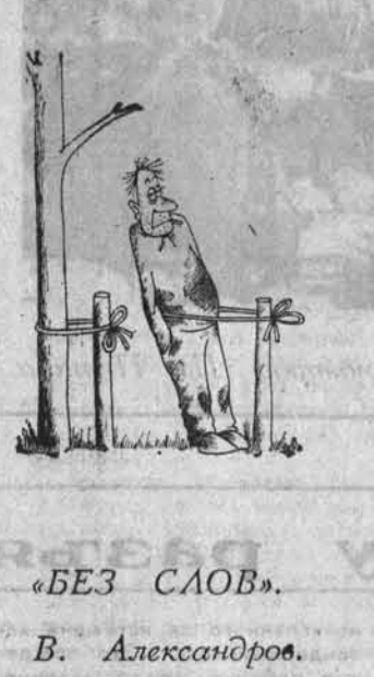
«БЕЗ СЛОВ». В. Александров.