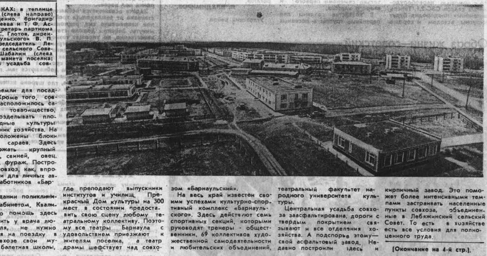
где преподают выпускники институтов и училищ. Преобразительный комплекс 300 метров в состоянии предоставления, свою сцену любому театру, все театры Барнаула с удовольствием приезжают к жителям поселка, а театр драмы шефствует над совхозом «Барнаульским».

В новом здании поликлиники с физиокабинетом, квалифицированную помощь здесь можно получить у врача любого профиля, не нужно тратить время на поездку в город. В совхозе свои музыкальная и балетная школы, театральная факультет народного университета культуры, преобразительный комплекс 300 метров в состоянии предоставления, свою сцену любому театру, все театры Барнаула с удовольствием приезжают к жителям поселка, а театр драмы шефствует над совхозом «Барнаульским». На весь край известен своим успехами культурно-спортивный комплекс «Барнаульцев». Здесь действует семь спортивных секций, которыми руководят тренеры — общественники, 69 коллективов художественной самодеятельности своей асфальтовой завод, и любительских объединений, киричный завод. Это помогает более интенсивными темпами застраивать населенные пункты совхоза, объединяющие в Лебяжинский сельский Совет. То есть в хозяйстве есть все условия для полноценного труда. [Окончание на 4-й стр.]