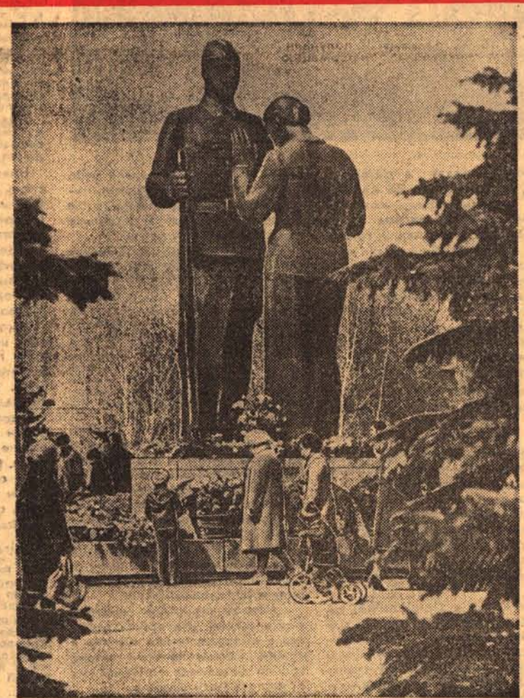
ройства и удали — спокойным сознанием правоты совершенного ими дела вошли они в историю. И вот уже ровно сорок лет мы живем под мирным небом. Вечный огонь у обелисков, пам-