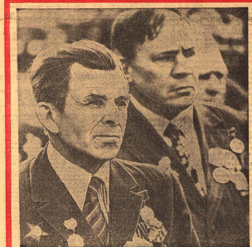
Вспомните: какие простые, какие прекрасные лица у этих солдат! Вот так же сорок с лишним лет назад изумлялись их простотой народы Европы на улицах освобожденных городов и деревень. Не с печатю гер-

«Земля алтайская. Твои поля были далеко от поля боя, над тобой не гремела канонада, не носились стараятниками в небе черные самолеты. Но и глубокий тыл был частью фронта. В дни войны цвет твой — пятнадцать тысяч коммунистов, пятьдесят тысяч комсомольцев, сотни тысяч солдат ушли на фронт. Он опален войною, этот цвет, — с полем сражений не вернулись больше ста двадцати тысяч воинов земли алтайской.