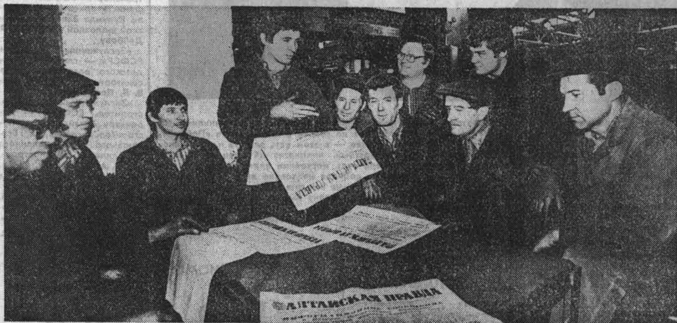
С чем идем к съезду

ТРУДЯЩИЕСЯ АЛТАЯ ГОРЯЧО И ЗАИНТЕРЕСОВАННО ОБСУЖДАЮТ МАТЕРИАЛЫ ПЛЕНУМА ЦК КПСС