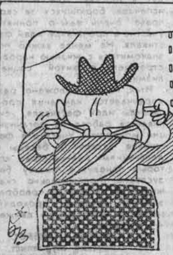
БЕЗ СЛОВ. Рис. Г. Вильма.