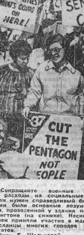
«Сокращайте военные расходы, а не расходы на социальные программы»...