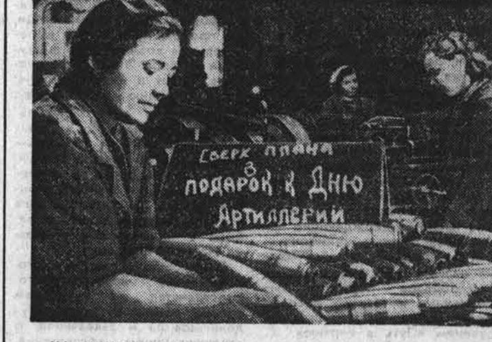
НА СНИМКЕ: артиллерийские снаряды сверх плана. Ленинград. 1944 год. (Репро-укия снимка из Центрального музея Вооруженных Сил СССР). Репродукция В. Христофорова и Б. Кавашкина. Фотохроника ТАСС.

Весте о коварном нападении гитлеровской Германии на СССР вызвала бурю негодования у монгольского народа. По всей стране пронзались мощные волны митингов и собраний, на которых трудящиеся Монголии выразили горячую симпатию своему великому другу — советскому народу. НА СНИМКЕ: во время передачи Красной Армией танковой колонии «Революционная Монголия», построенной на средства Монголии МНР. Фото МОНЦАМЭ — ТАСС.