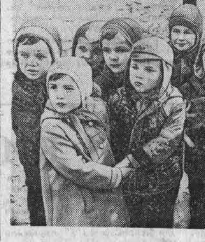
Командировка по письму

Кинофильм «Благие намерения» поставлен по одноименной повести Альберта Лиханова на студии имени А. Довженко. В центре фильма образ молодой учительницы Наде, полюбившей после окончания института назначение в школу интернат. В ее группе оказались дети, отцы и матери которых по тем или иным причинам были лишены родительских прав. Несмотря на то, что эти дети в интернате обеспечены всем и не испытывают ни в чем недостатка, им всем не хватает родительской ласки и внимания. Чуткая, отзывчивая на чужую боль, Наде написала в газету письмо и продолжила одиночные, безлетным людям брать на выхаживание и полюбивших, чтобы не чувствовали себя обделенными заботой взрослых. И. МАМАТКИНА.