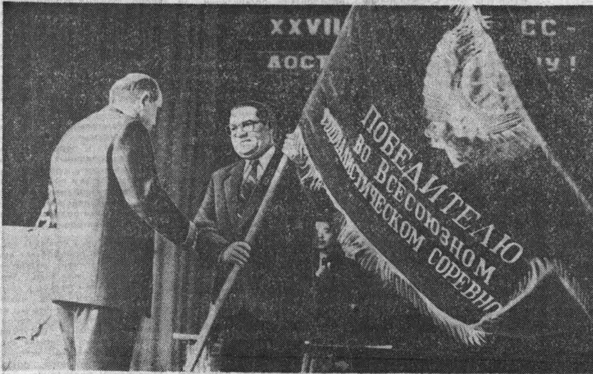
На снимках: момент вручения Красного знамени.

Мы заверяем Центральный Комитет КПСС, Совет Министров СССР, ВЦСПС и ЦК ВЛКСМ в том, что трудящиеся Алтайского края приложат все усилия, умение, опыт и знания для успешного претворения в жизнь решений XXVI съезда партии, последующих и внеочередного мартовского Пленума ЦК КПСС, встретят XXVII съезд ленинской партии новыми трудовыми успехами.