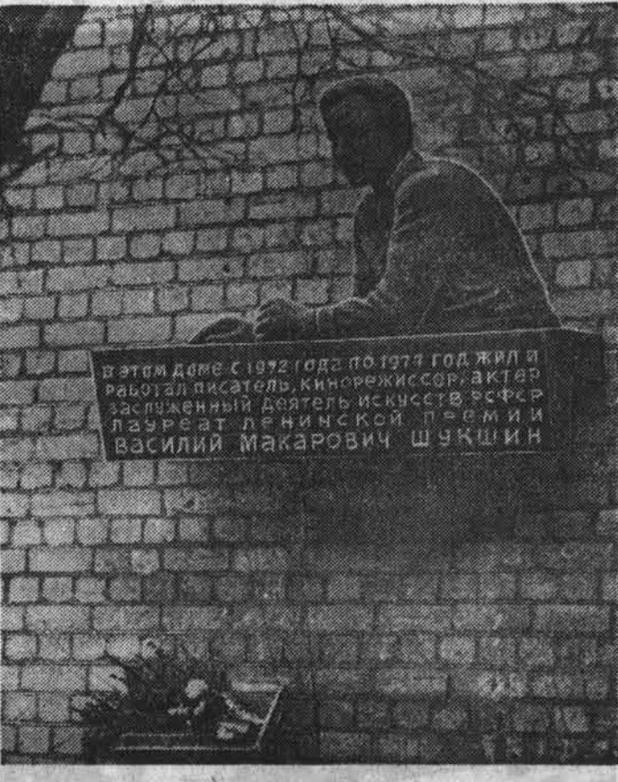
В этом доме с 1972 года по 1974 год жил и работал писатель, кинорежиссер, актер, заслуженный деятель искусств РСФСР, лауреат Ленинской премии и Василий Макарович Шукшин.