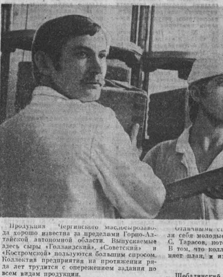
Продукция Черниговского мясокомбината хорошо известна за пределами Горно-Алтайской автономной области.