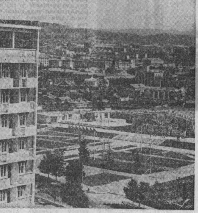
За годы народной власти неузнаваемо изменился Улаан-Батор.

НА СНИМКЕ: новые кварталы монгольской столицы.