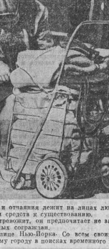
США. Печать, безысходности и отчаяния...

США. Печать, безысходности и отчаяния лежит на лицах людей, у которых нет ни работы, ни средств к существованию. Однако Белый дом мало это тревожит, он предпочитает не замечать трагического положения обездоленных сограждан. На снимке: бездомная на улице Нью-Йорка. Со всем своим нехитрым скарбом скитается она по большому городу в поисках временного пристанища.