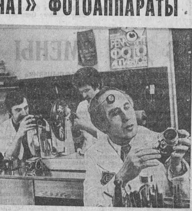
На рабочих столах бригады — десятки фотоаппаратов самых разных марок. За месяц через руки мастеров их проходит до 400 штук. Первое, что ощущает клиент, обращаясь в эту мастерскую, — доброжелательность. Здесь внимательно выслушают, дадут практический совет, постараются сделать ремонт в желательные для клиента сроки. Только у барнаульцев существует хорошее правило — гостям города ремонт вне очереди. Таким же правом пользуются и сельские фотографы в период полевых работ. Желающие могут здесь же приобрести фотоаппарат, им помогут зарядить фотоаппарат.

«Наша беда» — фотоаппараты устаревших марок, — рассказывает Кап, — очень трудно в запястных частях. Опыта мастера и здесь становится больше. Если позволяет возможность «вылечить» тот или иной устаревший фотоаппарат, то владельцу фотоаппарата, работающего на «Трансмаш».