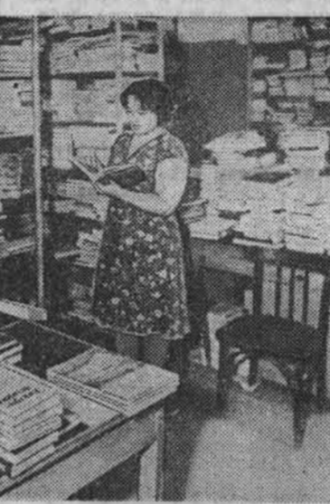
Библиотечный коллектор в работе.