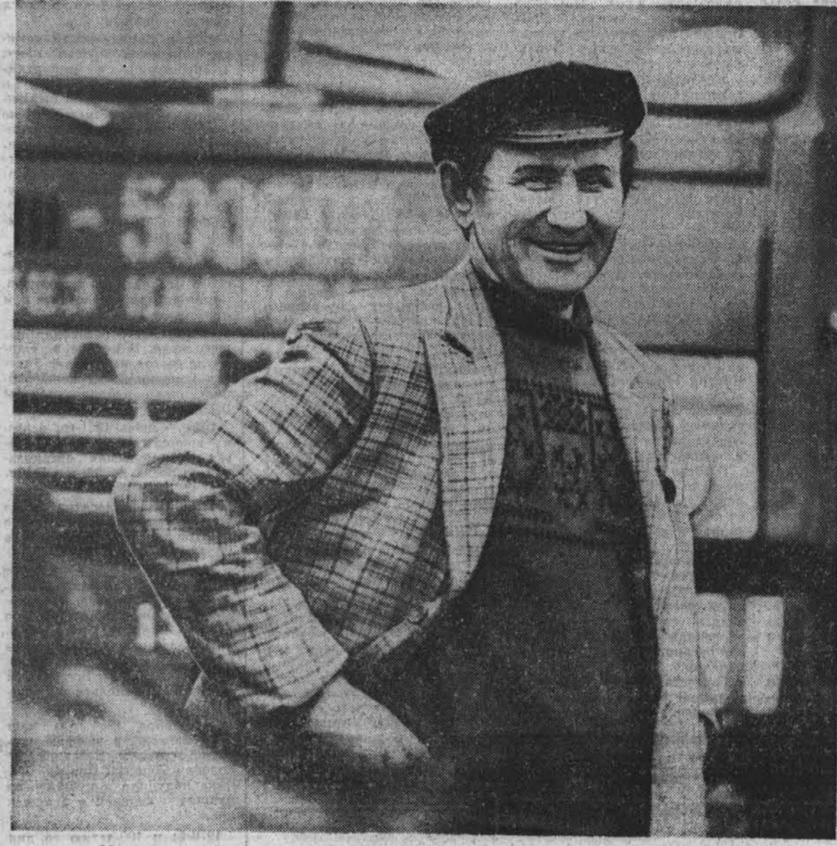
Материалы, посвященные Дню работников автомобильного транспорта, читайте на 3-й странице.