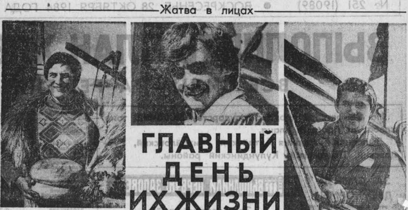
Жатва в лицах

Летопис славных комсомольских дел продолжается. Свою страничку в историю вписывают сегодня комсомольцы 80-х годов на строительстве Кузнецкого канала, завода химического волокна, хлебном поле, на животноводческих фермах в походе за большое молоко. Свои вклад в народное хозяйство вносят студенты — бойцы краевого студенческого строительного отряда «Алтай».