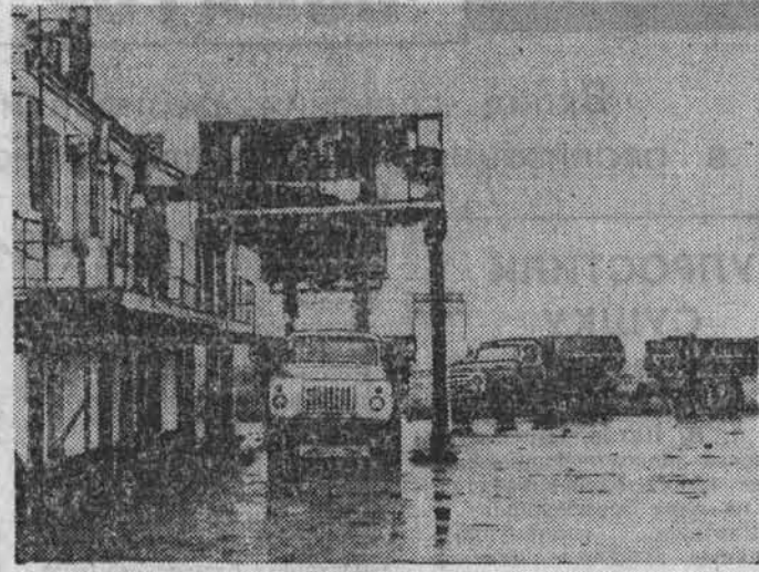
Слово о зерносушильщике