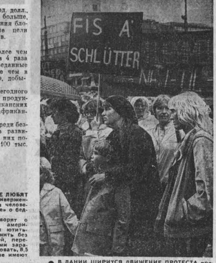
В ДАНИИ ШИРИТСЯ ДВИЖЕНИЕ ПРОТЕСТА против антисоциальной политики правительства. Тысячи государственных служащих, работников системы здравоохранения и образования Коппенгагена вышли на улицы города, чтобы заявить свое решительное «нет» программе «экономии», предусматривающей резкое сокращение ассигнований на нужды трудящихся.