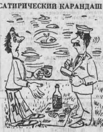
Я не допил вино и выплеснул в реку... Рис. А. Уварова