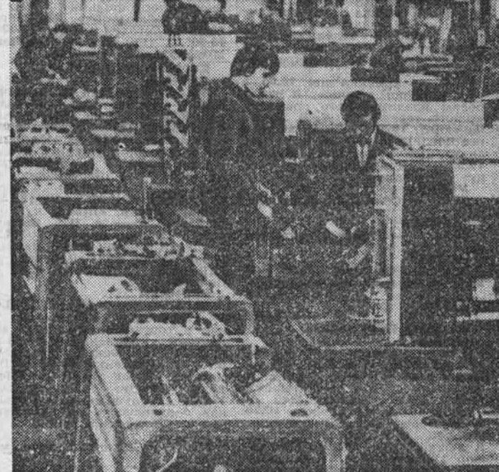
Высококачественные изделия полиграфической техники, изготовляемые машиностроительной промышленностью ГДР, экспортируются в Советский Союз и другие страны...