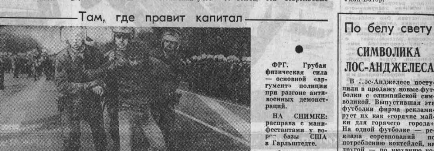
ФРГ. Грубая физическая сила — основной аргумент позиции при разгоне антикоммунистических демонстраций.

НА СНИМКЕ: расправа с манифестантами у вооруженных США в Гарльштеде.