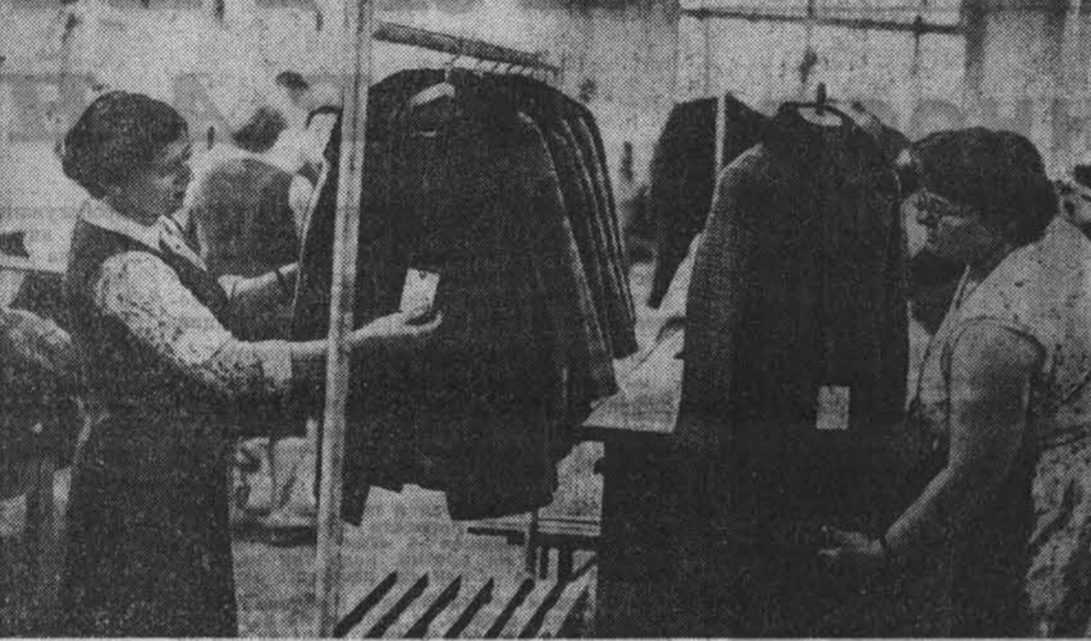
но и на первых порах становится для молодых наставниками в жизни, в их первых трудовых шагах.