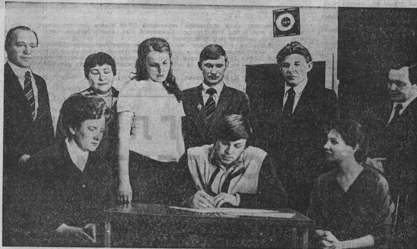
НА СНИМКЕ: во время подписания обращения.