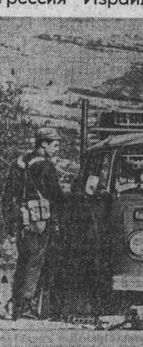
В страхе перед растущим сопротивлением палестинского населения израильские оккупанты усиливают волну террора на захваченных арабских территориях. На главной фотографии солдат израильской армии подвергает арабов повальным обыскам и арестам. НА СНИМКЕ: израильский контрольно-пропускной пункт на Западном берегу реки Иордан.