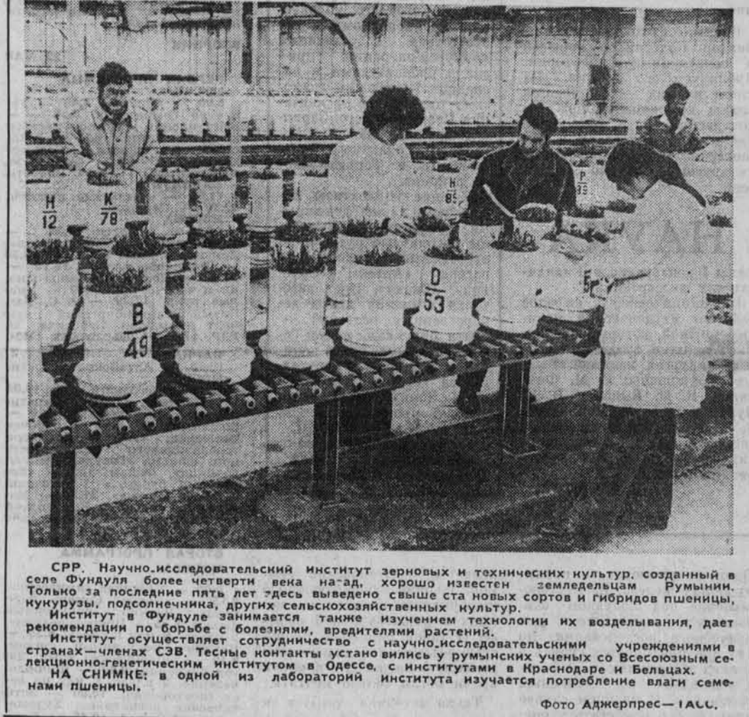
СРР. Научно-исследовательский институт зерновых и технических культур, созданный в селе Фундулли более четверти века назад, хорошо известен. Только за последние пять лет здесь выведено свыше ста новых сортов и гибридов пшеницы, ржи, кукурузы, подсолнечника, других сельскохозяйственных культур. Институт в Фундулли занимается также изучением технологии их возделывания, дает рекомендации по борьбе с болезнями, вредителями растений. Институт осуществляет сотрудничество с научно-исследовательскими учреждениями в странах — членах СЭВ. Тесные контакты установили с институтами в Краснодаре и Величке. На снимке: в одной из лабораторий института изучается потребление влаги семенами пшеницы.