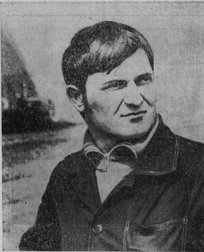
Вести с полей