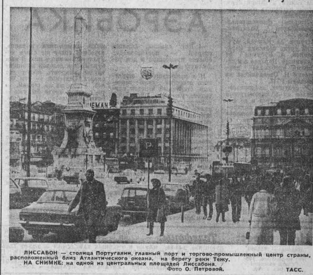
ЛИССАБОН — столица Португалии, главный порт и торгово-промышленный центр страны, расположенный близ Атлантического океана, на берегу реки Тему. НА СНИМКЕ: на одной из центральных площадей Лиссабона.

Сергей СОСНОВСКИЙ, корр. ТАСС. Аурих — Бонн.