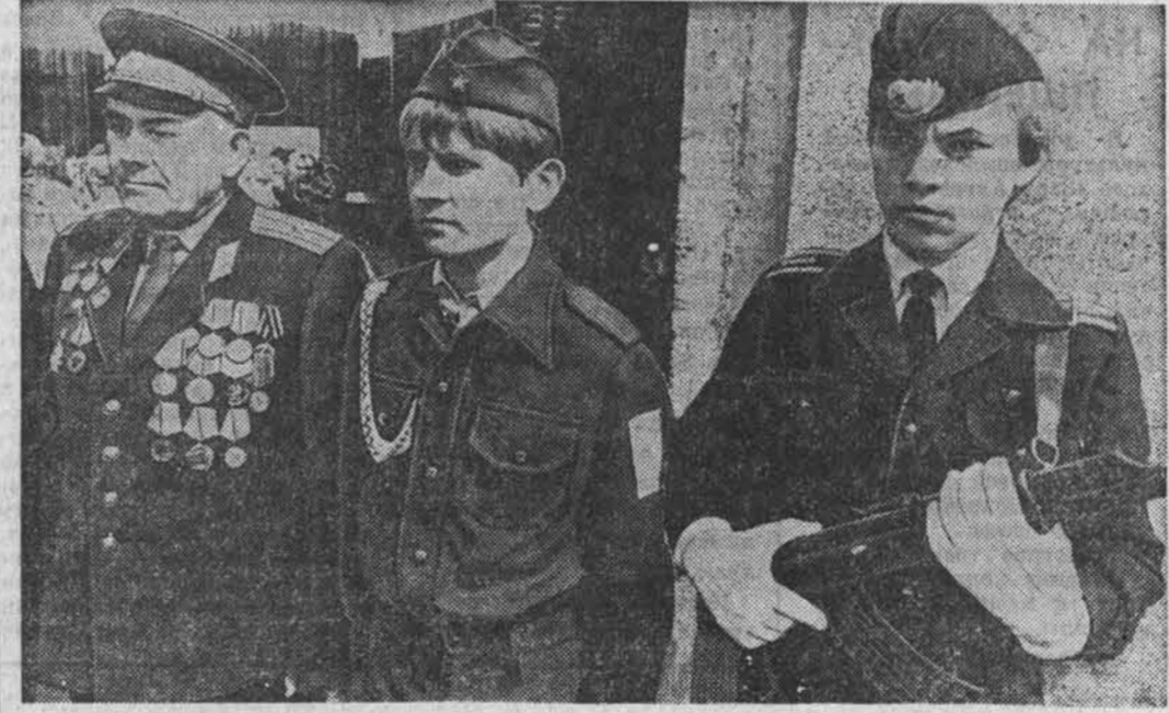
Зрелость и отроцтво. Убеленный сединами, в боевых наградах ветеран и безусые мальчишки, которым только через несколько лет предстоит нести почетную службу в рядах Советской Армии. Здесь, в карауле у Вечного огня, на посту № 1, они вместе, плачем и слезами, вспоминают тех, кто умер за Родину, мужеством, отвагой убит мальчишек ветеранов. Учат своим примером, верностью памяти погибших.