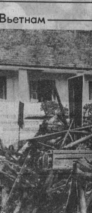
Сегодня название долины Дьенбьенфу, расположенной на северо-западе страны, известно каждому жителю СРВ. Здесь тридцать лет назад, 7 мая 1954 года, Вьетнамская народная армия одержала решающую победу над войсками французских колонизаторов, которые, развивая войну против демократического государства, создали в этом месте крупную военную базу и сосредоточили 16-тысячную армейскую группировку. На месте захвачен не смогли остановить негуманный порыв вьетнамских патриотов. С победой при Дьенбьенфу на севере страны были созданы условия для построения социализма. Сегодня героические традиции Дьенбьенфу продолжают в самом отдаленном мирном уголке жителей этого района. Здесь ведется строительство жилых домов, больниц, школ, стадионов, аккредитуются новые лесные массивы. НА СПИМКЕ: во дворе музея, материалы которого знакомят с историей сражения в долине Дьенбьенфу.

ОБЕРВИЛЬЕ (департамент Сена-Сен-Дени). (ТАСС). Мобилизация молодежи всех стран на борьбу против гонки вооружений, за сохранение мира на земле — такова главная тема многочисленных дебатов представителей прогрессивных молодежных организаций Франции — участников третьего фестиваля французской молодежи «За мир и разоружение». В этом двухдневном празднике приняли участие представители молодежных организаций из СССР, США, Англии, Португалии и ряда других стран.