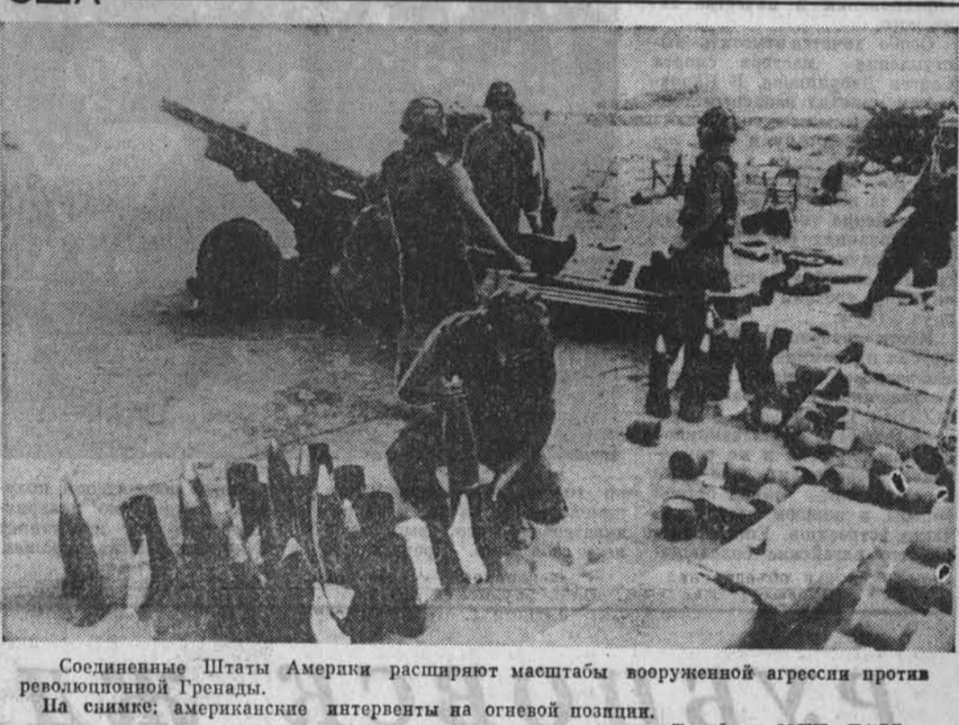
Соединенные Штаты Америки расширяют масштабы вооруженной агрессии против революционной Гренады. На снимке: американские интервенты на огневой позиции.