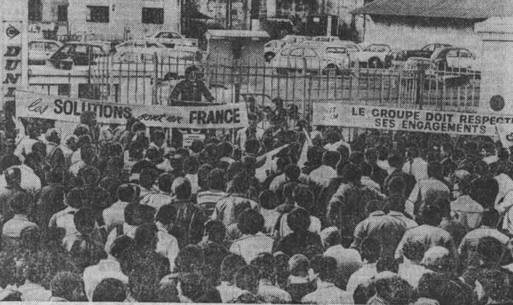
Небольшой городок Мондосон приковал к себе сейчас внимание всей трудовой Франции. Крестному шипному предпринятию, существующему здесь с 1921 года, грозит ликвидация, а 2.800 трудящихся — увольнение.

Генерал-лейтенант Дм. ВОЛГОГОНОВ, доктор философских наук, профессор. (АПН).