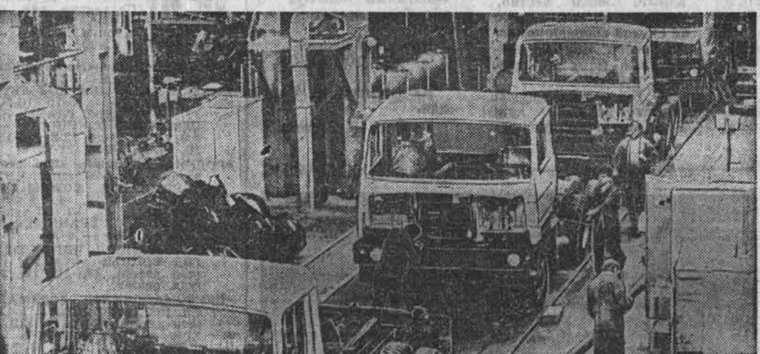
Десять тысяч новых грузовиков «Татра-815» планирует выпустить в этом году коллектив автомобильного завода в городе Копршивнице. Новая машина заменит производившиеся ранее «Татру-148» и «Татру-813».