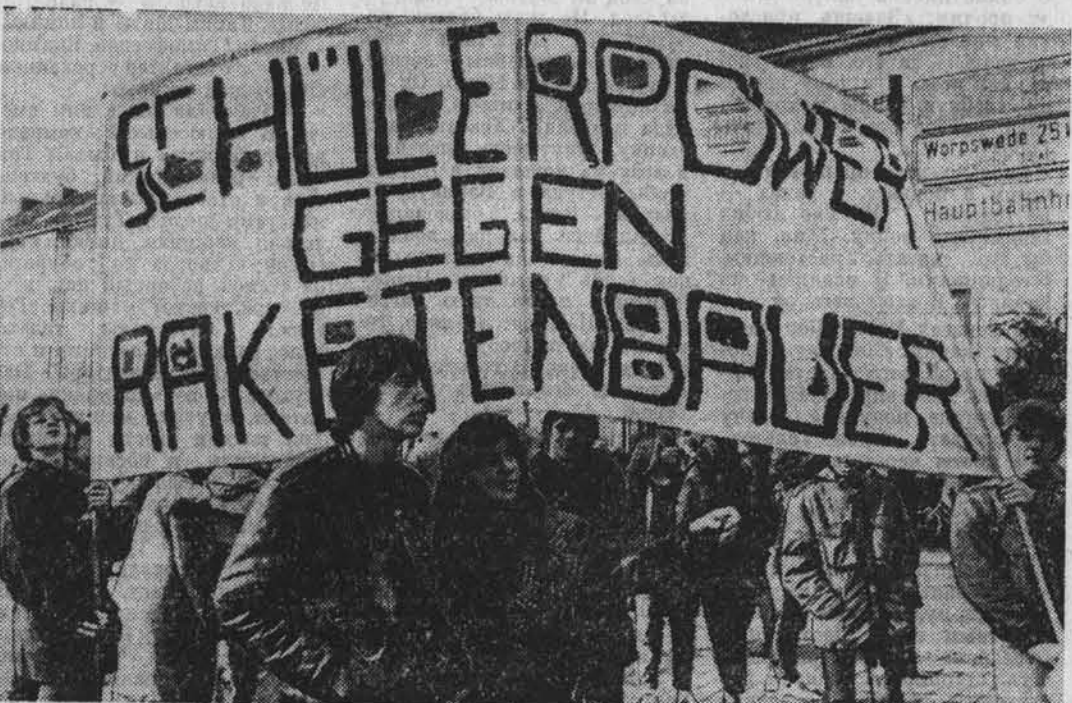
Под лозунгами борьбы за мир и разрядку в ФРГ прошла Неделя действий против размещения на территории страны новых американских ядерных ракет средней дальности. На снимке: тысячи педагогов, студентов и школьников вышли на улицы Бремена, чтобы выразить решительное «Нет!» зловещим замыслам американской военной промышленности превратить ФРГ в стартовую площадку для «Першингов-2» и крылатых ракет.