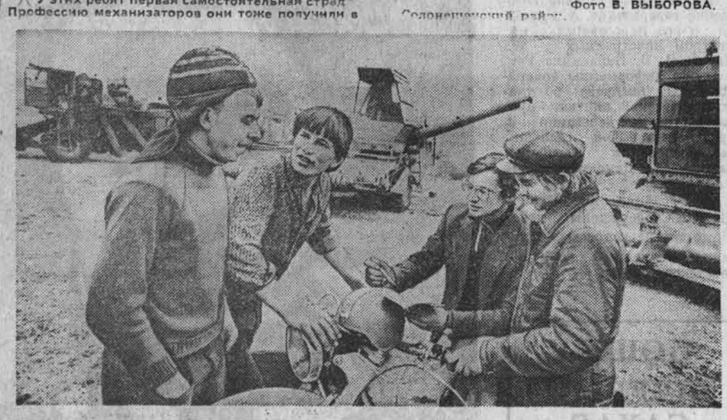
У этих ребят первая самостоятельная страд. Профессию механизаторов они тоже получили в